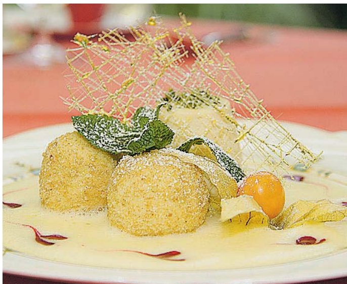
Dessert-Fan Hermann Wögerbauer schlägt als Nachspeise an den Festtagen Topfenknödel auf Weinschaum und Vanilleparfait vor.

Ein Dessert-Klassiker – raffiniert abgewandelt: Statt das Tiramisu in einer großen Form anzurichten, wird es zu kleinen Törtchen verarbeitet. Zunächst muss das Eigelb aus sechs frischen Eiern mit Zucker und Lebkuchengewürz schaumig geschlagen werden. Als näch-